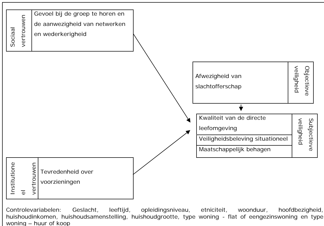
Figuur 9.1: Onderzoeksmodel

Bij de analyse van het model zijn beschrijvende en toetsende analyses uitgevoerd. De beschrijvende analyses lieten zien dat de respondenten over het algemeen Nederlands, hoogopgeleid en van middelbare leeftijd zijn en een relatief hoog inkomen hebben. Ook wonen veel respondenten alleen of samen zonder kinderen. Het sociaal vertrouwen van de respondenten is redelijk tot hoog te noemen en het institutioneel vertrouwen redelijk tot goed. Een kwart van de respondenten gaf aan het afgelopen jaar slachtoffer geweest te zijn van een delict. De kwaliteit van de directe leefomgeving is laag tot redelijk. De veiligheidsbeleving situationeel is redelijk hoog en het maatschappelijk behagen is redelijk laag.